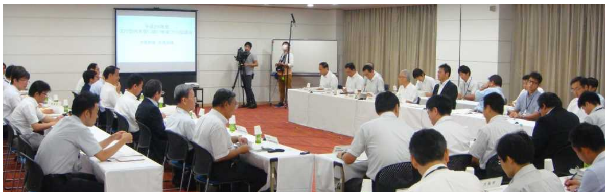
前回の「淀川管内水害に強い地域づくり協議会 首長会議(大阪)」の開催状況

「取り戻す」：堤防決壊による大規模な浸水から1日でも早く日常生活や都市機能を回復すること